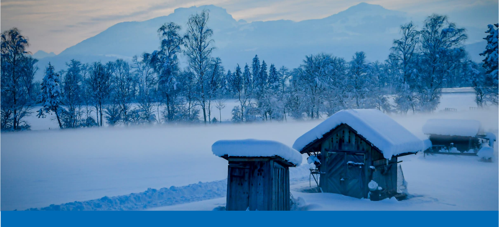
Rheintaler Riet im Winter